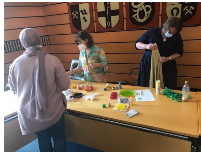
Foto: Zukünftige Elternbegleiterinnen bei der Entwicklung eigener Spiel- und Förderideen

Mehr als 300 Familien besuchen die Griffbereit-, Rucksack KiTa und Rucksack Schule- Gruppen in vielen Städten des Kreises, um die Entwicklung ihrer Kinder zu unterstützen. Dabei ist die Arbeit der Elternbegleiter*innen ein wichtiger Bestandteil der Programme. Sie unterstützen die beteiligten Familien bei den wöchentlichen Treffen und geben Tipps und Hilfestellungen, damit die Eltern ihre Kinder zu Hause optimal fördern und so den Bildungsweg positiv unterstützen können. Ziel der Programme ist es, Eltern schon früh einzubinden und Erziehungs- und Bildungspartnerschaften zu fördern.