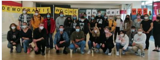
Teilnehmer*innen der Demokratie-Woche.

Mit pandemiebedingter einjähriger Verzögerung konnte die langersehnte Demokratiewoche an der Werner-von-Sie-