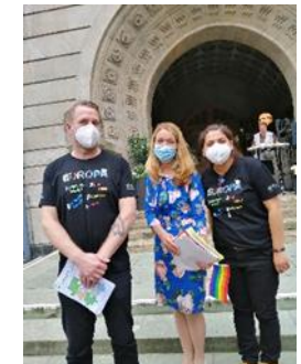
Übergabe der Unterschriften...

der Bürgermeisterin bei der Abschlusskundgebung auf dem Willy-Brand-Platz übergeben wurden.