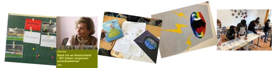
Impressionen aus den Projekten.

Zum krönenden Abschluss der Demokratiewoche fanden sich die Schülerinnen und Schüler auf dem Rathausplatz wieder. Gemeinsam mit den Schülerinnen und Schülern des Inner Circle und den Mitgliedern des Jugendrats, wurden alle gesammelten Unterschriften zur Gladbecker Erklärung der Bürgermeisterin übergeben